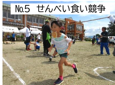
No.5 せんべい食い競争