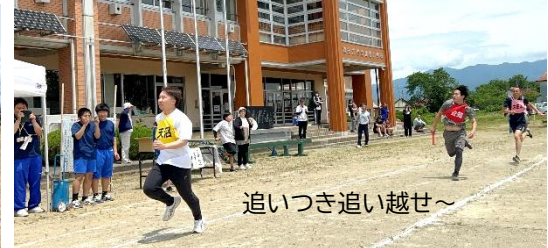
追いつき追い越せ～