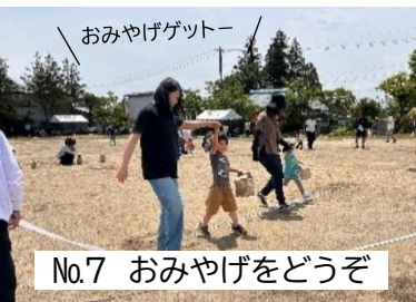
No.7 おみやげをどうぞ