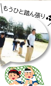
もうひと踏ん張り!