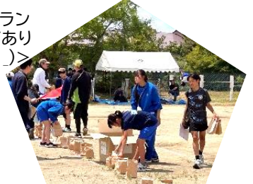
運動会ばんざーい