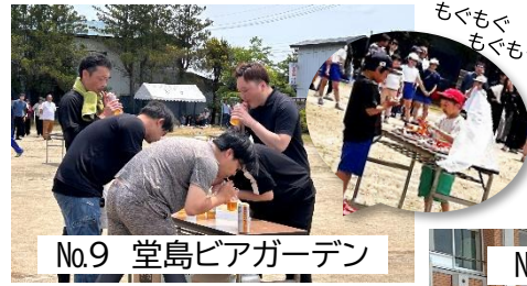
No.9 堂島ビアガーデン