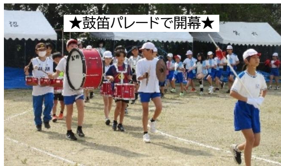
★鼓笛パレードで開幕★