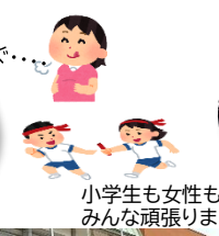
小学生も女性も みんな頑張りました