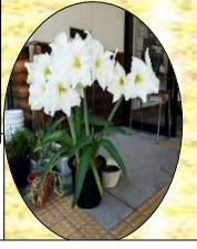
一度に 12 輪咲 アマリリス