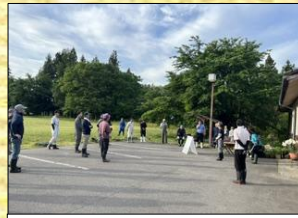
5月31日 除草作業 岩月まちおこし委員会