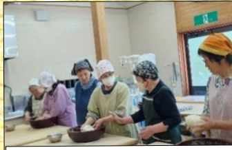
5月27日 そば打ち 手作りクラブ