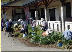
5月6日 除草作業 なのはな学級