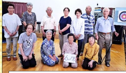
6月19日 移動公民館 稲村サロンにて吹き矢を体験