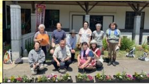
6月17日 寄せ植え 大仏・もみの木学級