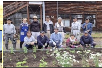
6月9日 花植え 岩月老人クラブ いわつきボランティア