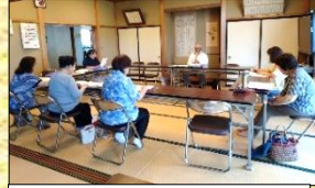
6月18日 開講 民謡教室