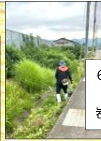
6月28日 県道草刈 岩月町行政区長会