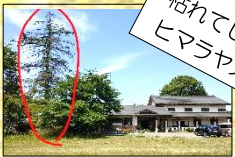
枯れてしまった ヒマラヤスギ