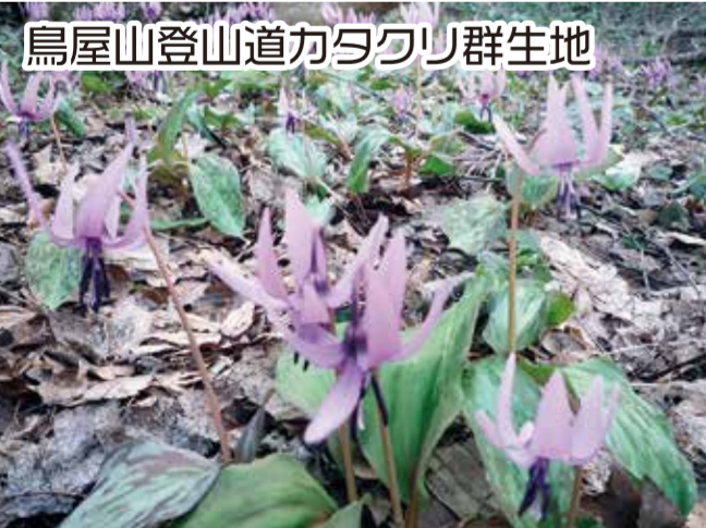
鳥屋山登山道カタクリ群生地

一等三角点のある580.6mの低山ながら、山頂からは飯豊連峰、磐梯山などの名峰を遠望できます。