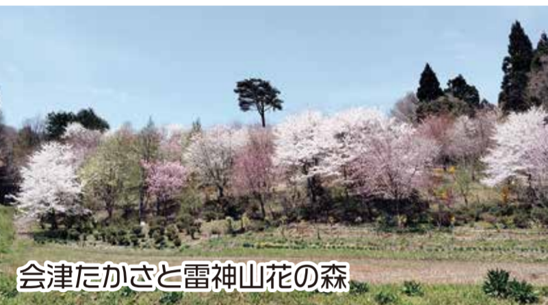
会津たかさと雷神山花の森

サクラ、レンギョウ、ユキヤナギなど約60種類、2,000本を超える花木が色とりどりの花を咲かせます。