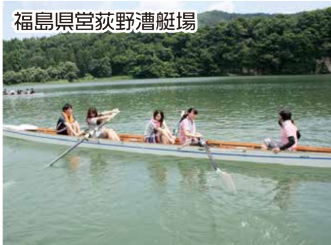
福島県宮荻野漕艇場

国体や高校総体、シティレガッタ大会などの会場となっているほか、合宿などにも使用されています。