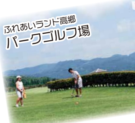
ふれあいランド高郷パークゴルフ場

国体や高校総体、シティレガッタ大会などの会場となっているほか、合宿などにも使用されています。