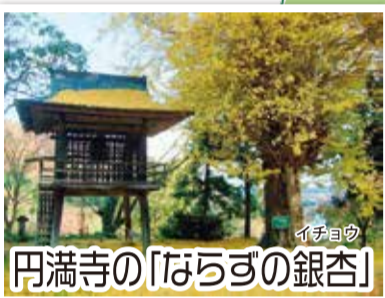
円満寺の「ならずの銀杏」

サクラ、レンギョウ、ユキヤナギなど約60種類、2,000本を超える花木が色とりどりの花を咲かせます。