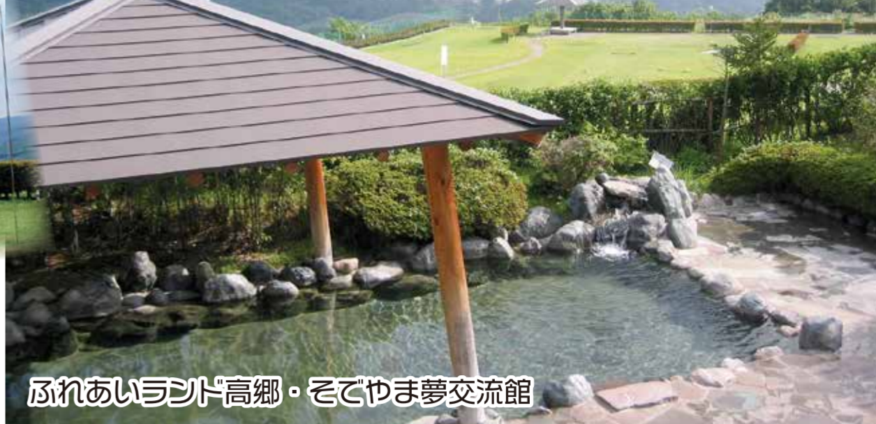
ふれあいランド高郷・そでやま夢交流館

クラブ1本で楽しめる「公園でのゴルフ」です。18ホールあり、日本パークゴルフ協会公認のホールです。