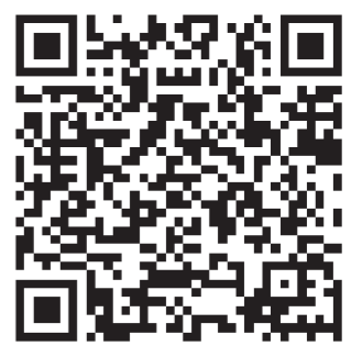
▲ごみの分別一覧表はこちら (喜多方地方広域市町村圏組合)