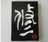
オンリーワンの作品♪