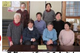
元気いっぱいみなさん

今年度はシナプソロジー体験から始まり、移動研修やこども園との交流、作品展示会では「むつみ食堂」として豚汁やもちの提供を行うなど大活躍のみなさん。次年度も充実した学級になるよう事業計画を話し合いました。