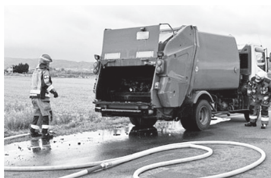
▲令和6年12月に本市で発生した車両火災