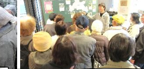
こだわりのワイン製法