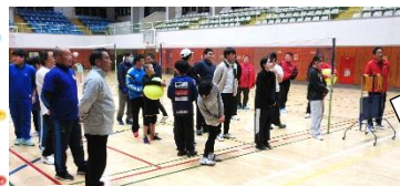
塩川剣道スポ少など 子供から大人まで参戦！

今年度で2回目になる塩川ふらば～る交流大会を、ファミリースポーツタイムと同日に開催しました。「フラバール」とは、変形した丸い形のボールを使って対戦するバレーボールのようなニュースポーツ。今年は6チームの参加があり、ファインプレー続出の白熱した試合となりました！表彰式のあとはお楽しみ抽選会でしめくり大賑わいの交流大会となりました♪ ぜひ来年も皆さんの参加をお待ちしています。