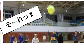
ぼよ～ん♪当たっても全然痛くない！