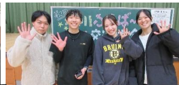
チーム作戦は「攻め」でした！