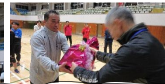
入賞おめでとうございます！