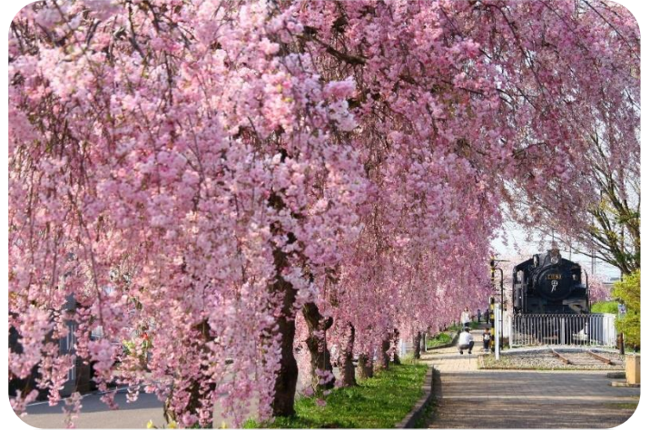
日中線しだれ桜並木