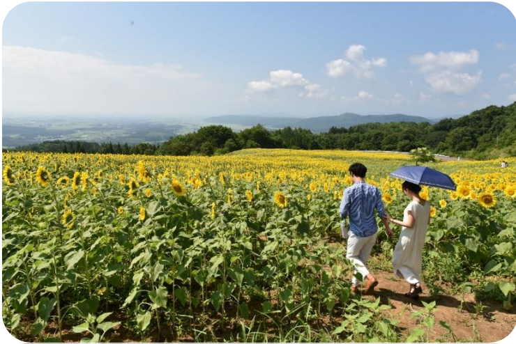
三ノ倉高原ひまわり畑