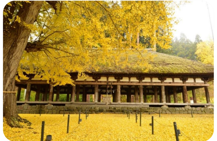
新宮熊野神社長床イチョウ