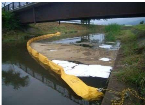
油の回収 オイルフェンスの設置

油の回収には、オイルフェンスマットなどを使用するため、回収に要した費用は、原因者が負担することになります。