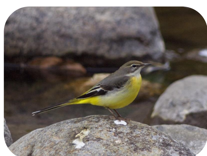
喜多方市の鳥 セキレイ