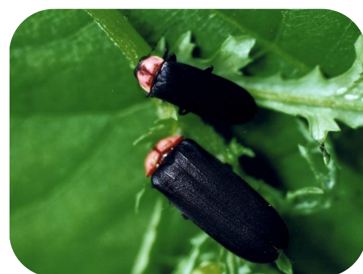
喜多方市の昆虫 ホタル