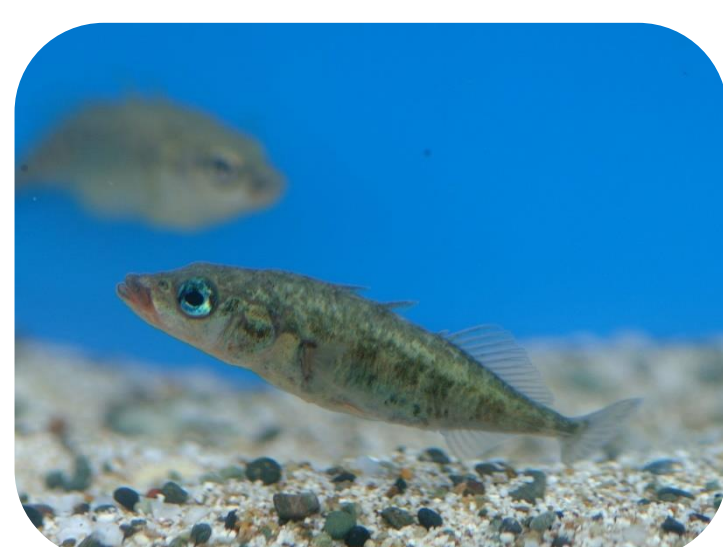
喜多方市の魚 イトヨ