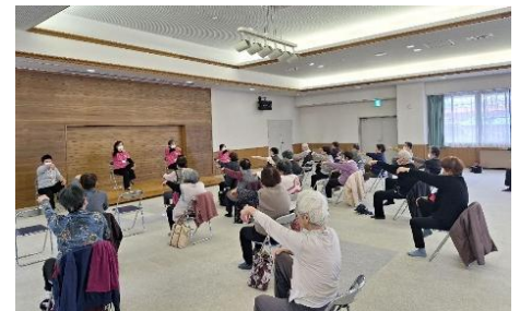
直営教室（福祉センター）の様子

地区推進事業では、太極拳ゆったり体操と一緒に体組成測定、口腔講話、栄養講話、フレイル予防の健康教育・健康相談等の追加プログラムも実施し、更なるフレイル予防を実施しています。