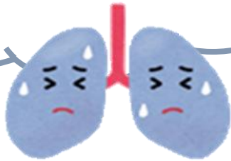
<COPD 死亡率>人口10万対 福島県保健統計

本市の現状： 慢性閉塞性肺疾患（COPD）の死亡率は 全国及び県平均を大きく上回っている 現状です。