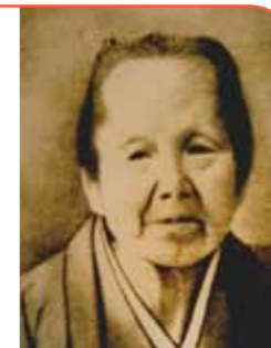
うりゆう いわこ 瓜生 岩子

瓜生岩子は、文政12年に小田付村（北町）に生まれました。夫や母に先立たれた岩子は大変悲しみが多かったが、世の中には不幸な人が多いことを思い、それらの人のために尽くそうと決心しました。戊辰戦争では、敵、味方の別なく傷ついた人を看護しました。また、貧しい人や親のない子供達の救済と教育に奔走し、日本のナイチンゲールと讃えられました。