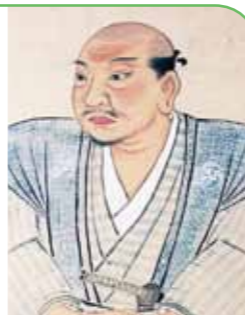
なかえ とうじゆ 中江 藤樹

中江藤樹は、近江の国の高島郡小川村（現滋賀県高島市）に今から380年前に生まれました。藤樹の教えは、立派な道徳を身につけ父母や周囲に「孝」を尽くすことにあります。一人ひとりが自分の曇りのない心をつかむこと、つかんだらこの心に基づいて行動すること、そうすることで、親や子供を幸せにできるという考えです。喜多方では約220年にわたりその教えが脈々と引き継がれています。