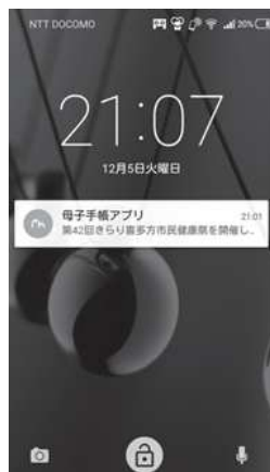
プッシュ通知の表示