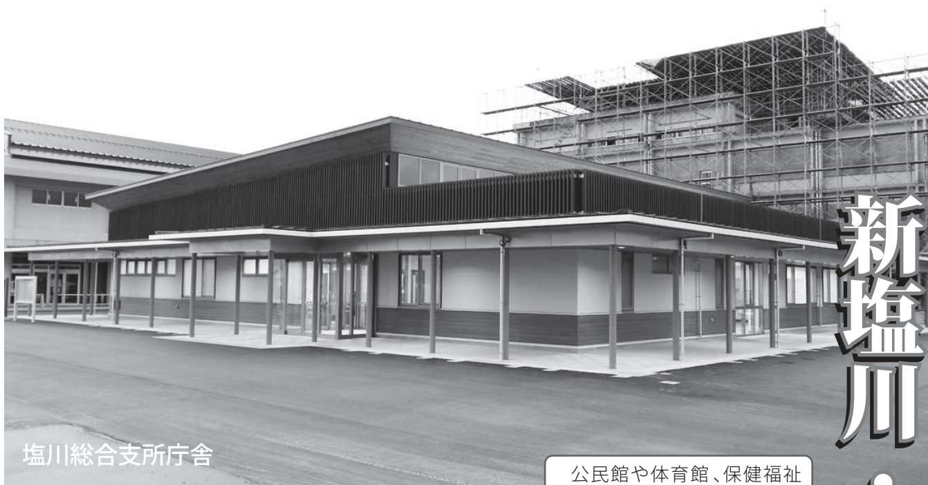
塩川総合支所庁舎

公民館や体育館、保健福祉センターと隣接し、地域の活動拠点としての強みも増した塩川総合支所庁舎を紹介します。