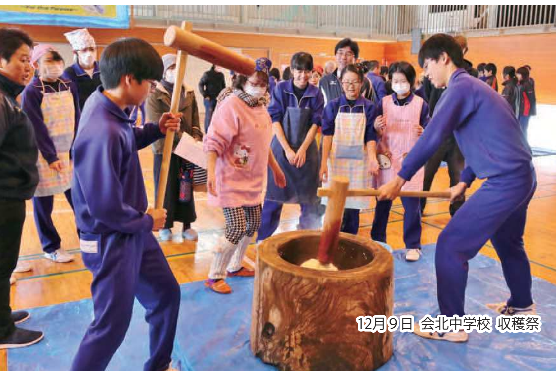
12月9日 会北中学校 収穫祭