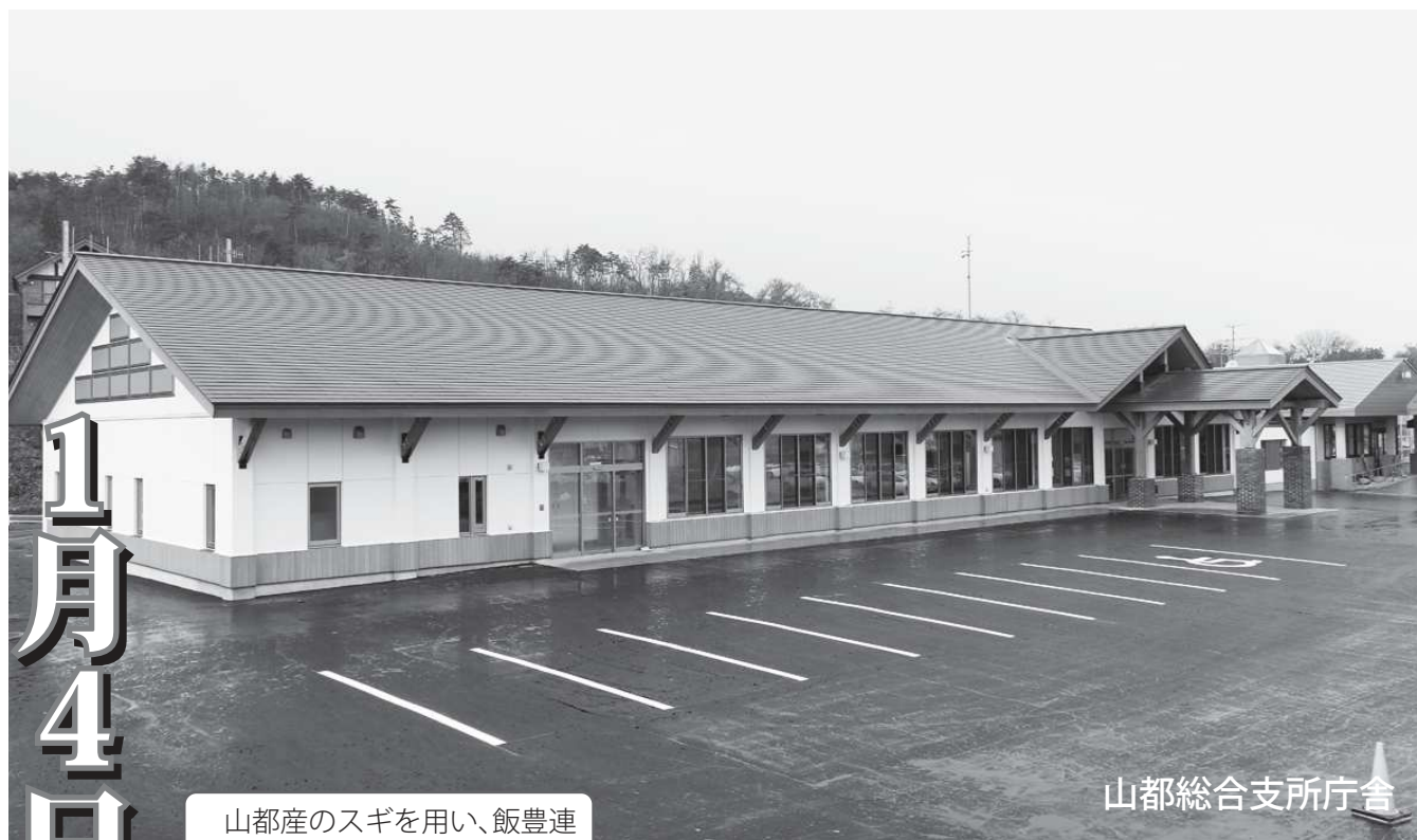
山都総合支所庁舎

山都産のスギを用い、飯豊連峰の稜線をイメージしたデザインが特徴の山都総合支所庁舎を紹介します。