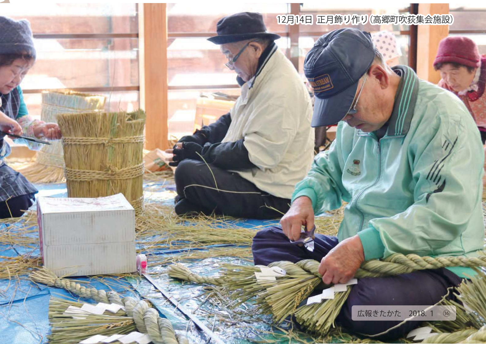
12月14日 正月飾り作り(高郷町吹萩集会施設)