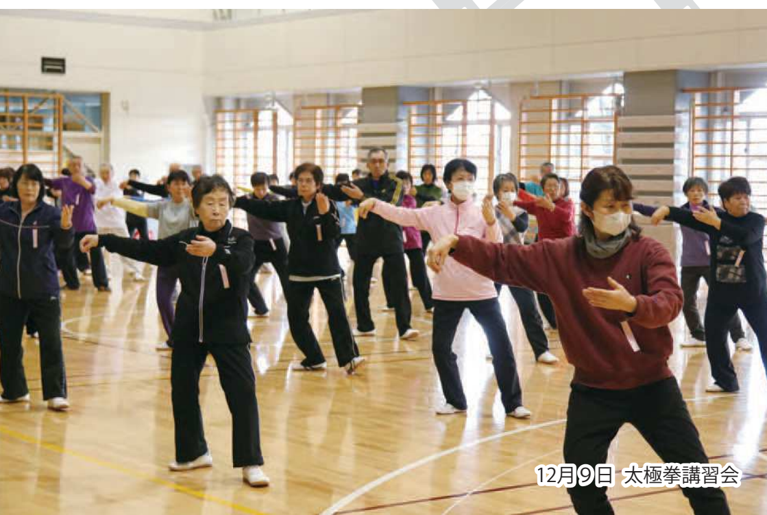
12月9日 太極拳講習会