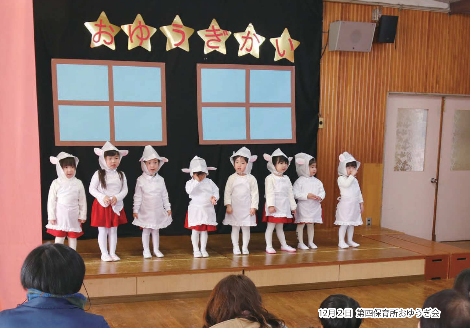
12月2日 第四保育所おゆうぎ会